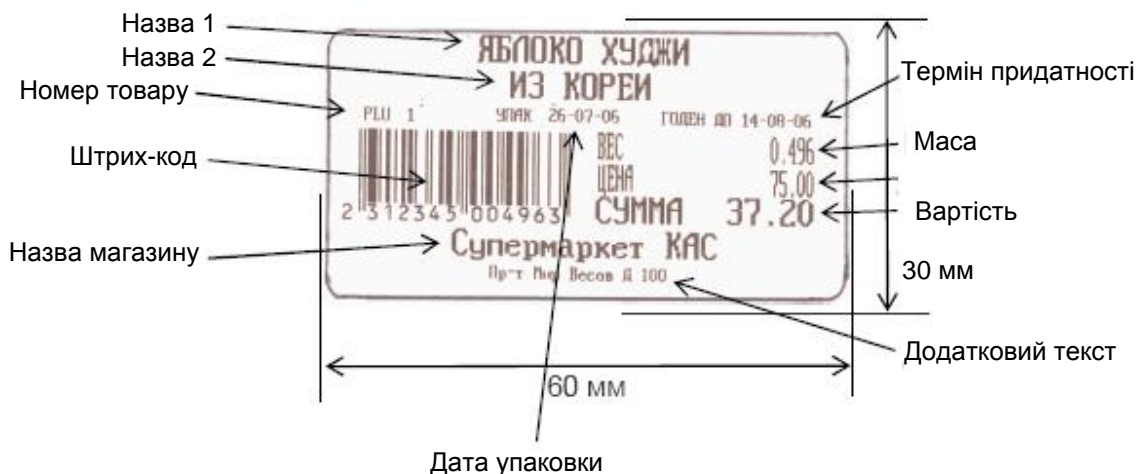
Рис.2 – Приклад формату етикетки