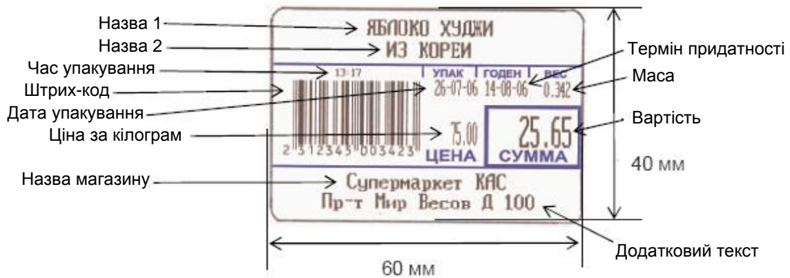
Рис.3 – Приклад формату етикетки